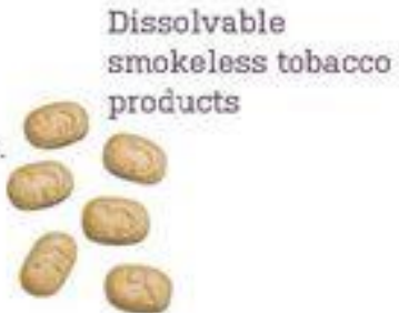
Dissolvable smokeless tobacco products